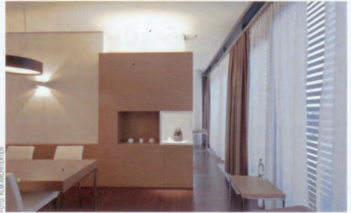
Die Zimmer bestechen durch klassische Eleganz. Komplettausstatter Zieffe-Koch aus Waldachtal realisierte die Ideen der Hotelplaner.

gen Glastower haben die Berliner Hotelplaner klm-Architekten ( www.hospitality-design.de ) 20 stilvoll und individuell gestaltete Designer-Suiten eingerichtet, die durch ein hausinternes Netzwerk eigenständiger Nutzungen zu einem kompletten Full-Service-Hotelangebot ergänzt werden.