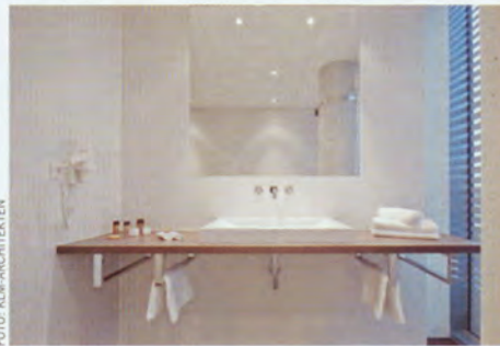
Puristisch mit viel Stil präsentieren sich die Bäder.

Ausgestattet mit getrennter Ankleidezone und teilweise getrennten Wohn- und Schlafräumen, erfüllt jedes Zimmer höchste Ansprüche.