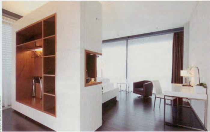
Die großzügigen Suiten bieten zwischen 27 und 58 m 2 Platz und durch ihre geschickte Aufteilung Individualität.